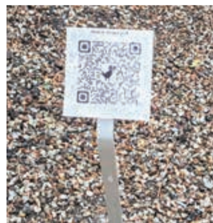
Der er sat QR-koder op ved gravene, så man selv kan læse mere på sin telefon.