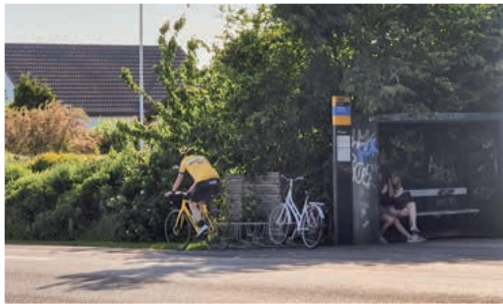
Buspassagerer kan roligt søge mod busstoppestedet i fremtiden også – linje 250S er sandsynligvis reddet.

Region Østdanmark vil få et fælles regionsråd og et forretningsudvalg. Sideløbende findes seks sundhedsråd, hvor kommunerne i regionen deltager. I 2026 forbereder de nyalgte regionsråd i de to regioner sammenlægningen.