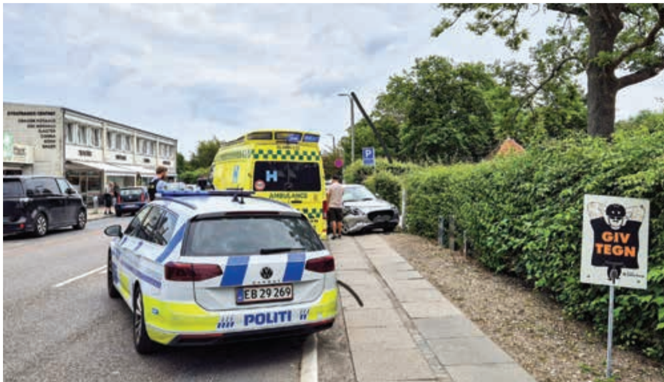
Airbaggen i passagersiden på en nyere Suzuki Swift var blevet udløst ved sammenstødet, der gav ret massive skader på højre del af Suzukiens front.

»Det er rigtig dejligt, at Kommunernes Landsforening og regeringen har mødtes så hurtigt og fået den på plads, så forvaltningen kan nå at få materiale på plads til de budgetmapper, vi skal bruge som grundlag for budgetlægningen.«