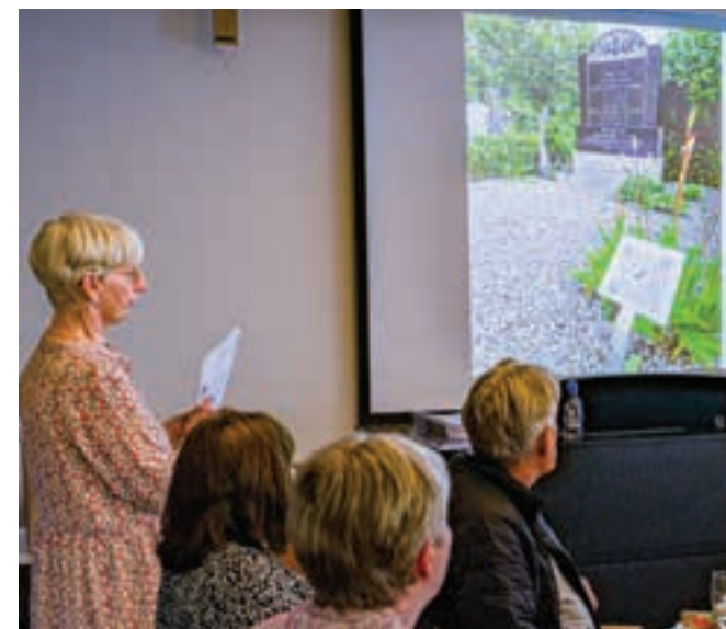
Kirken markerede for nyligt udgivelsen med et arrangement i sognegården.